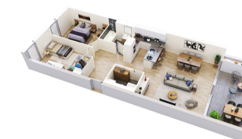
Appartement 3.5 pièces