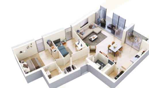
Appartement 3.5 pièces