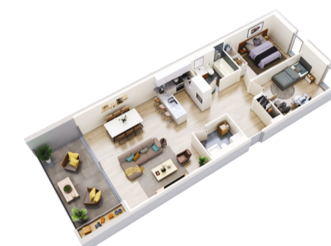
Appartement 3.5 pièces