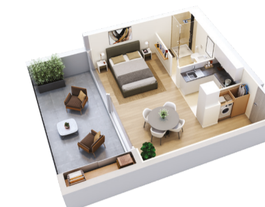
Appartement 1.5 pièce