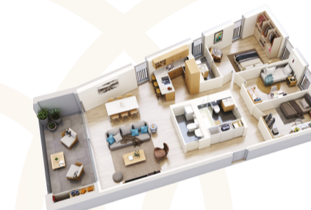
Appartement 4.5 pièces