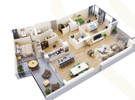
Appartement 5.5 pièces